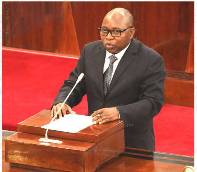
Mhe. Dkt. Damas Ndumbaro (Mb) Waziri wa Katiba na Sheria

O fisi ya Wakili Mkuu wa Serikali kwa Mwaka wa Fedha 2023/24 imefanikiwa kutengewa bajeti ya shilingi bilioni 17 kwa ajili ya kutekeleza majukumu yake ya kila siku.