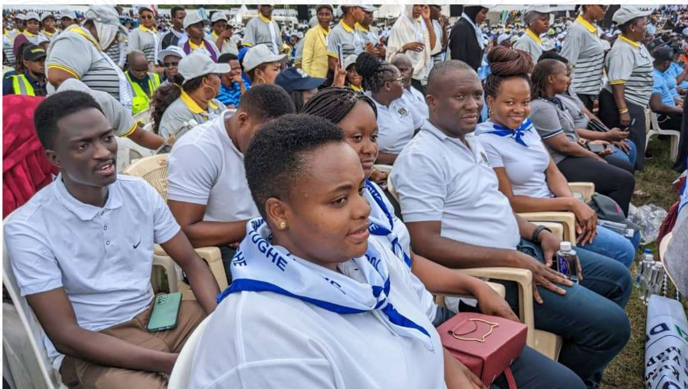
Baadhi ya watumishi wa Ofisi ya Wakili Mkuu wa Serikali wakishiriki Kilele cha Maadhimisho ya Serehe za Mei Mosi Kitaifa Mkoani Morogoro.