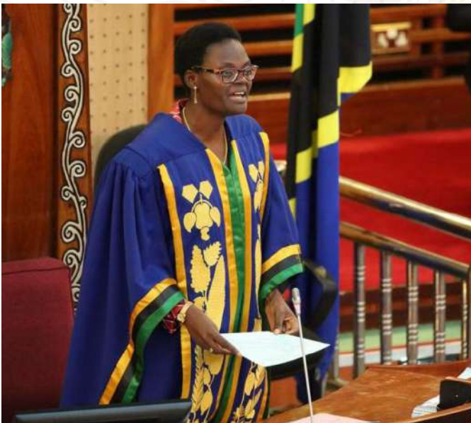
Mhe. Dkt. Tulia Ackson Spika wa Jamhuri ya Muungano wa Tanzania